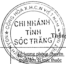
Biểu mẫu 6B

Thống kê số liệu về tổ chức bộ máy, biên chế hành chính tại sở ban ngành, UBND cấp huyện